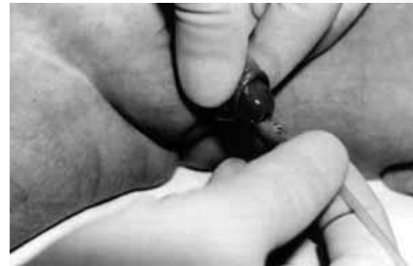
Fot. 2. Cewnikowanie bezpośrednio ręką